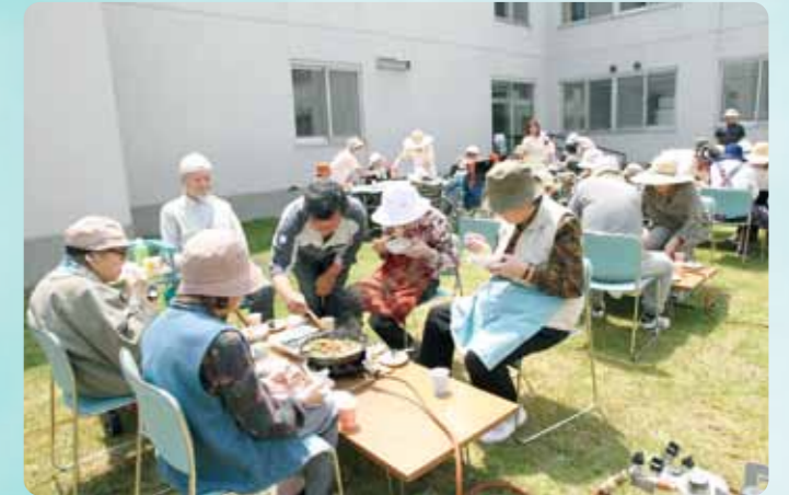
●屋外ジンギスカン