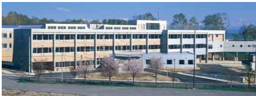
特別養護老人ホーム 敬生園