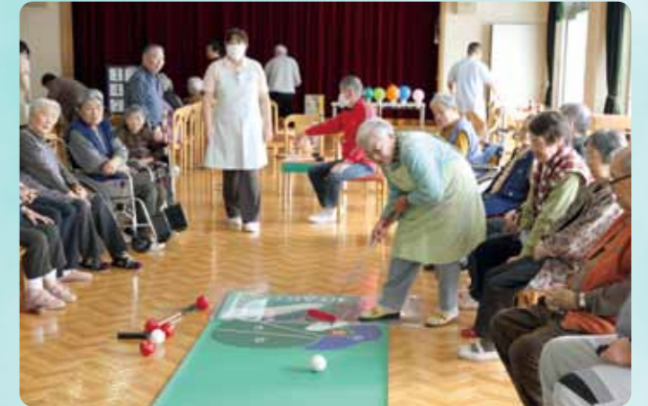
●レクリエーション