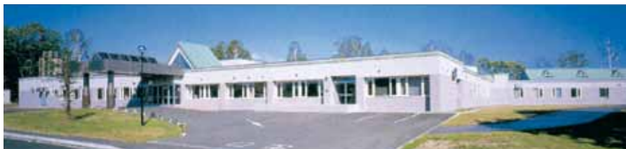
障害者支援施設 敬愛園 障害者支援施設 敬愛園(通所)